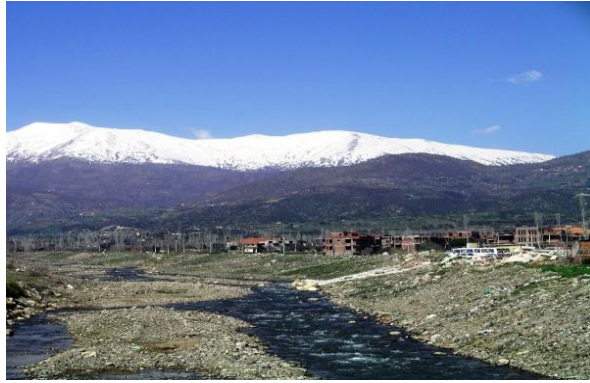
Küçük Menderes Vadisi ve Bozdağ