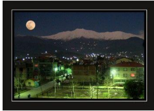
Küçük Menderes'ten Bozdağ'a Gece