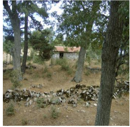
Haliller Köyü Tarihî Eserleri

Osmanlı Dönemi eseridir. Çayağzı Köyü, Tarlabası Mh. Kırtaş Tepe'de yer alır. Dikdörtgen planlı türbe moloz taştan inşa edilmiştir. Ahşap beşik çatısı marsilya kiremit kaplıdır. İçinde moloz taşlarla örülü bir mezar vardır. İçinde türbenin yer aldığı geniş bir alana yayılmış mezarlık, yöre halkı tarafından kutsal bir yer olarak kabul edilmektedir. İzmir II Numaralı KTVKK'nun 26.01.2006 tarih ve 1770 sayılı kararı ile tescil edilmiştir.